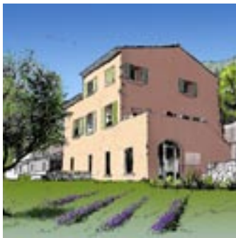
Bastide aux violettes – Route Ferrage

Potrete anche acquistare i vari prodotti provenienti dal terreno della masseria.